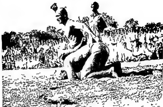
Fig 5 Vajramusti Wrestling End